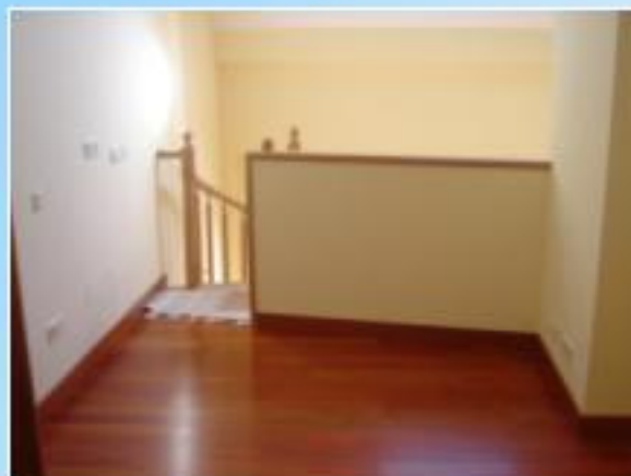
Habitación en vivienda tipo dúplex.