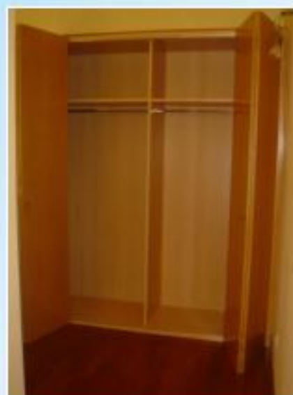
Interior de amario forrado con balda y barra.