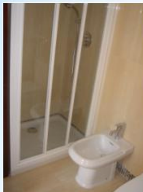
Cuartos de baño chapados de gres gran formato con cenefas decorativas equipados de plato ducha con mampara, toalleros, espejo, lavabo de porcelana vitrificada con grifería mono-mando, bidé y inodoro.