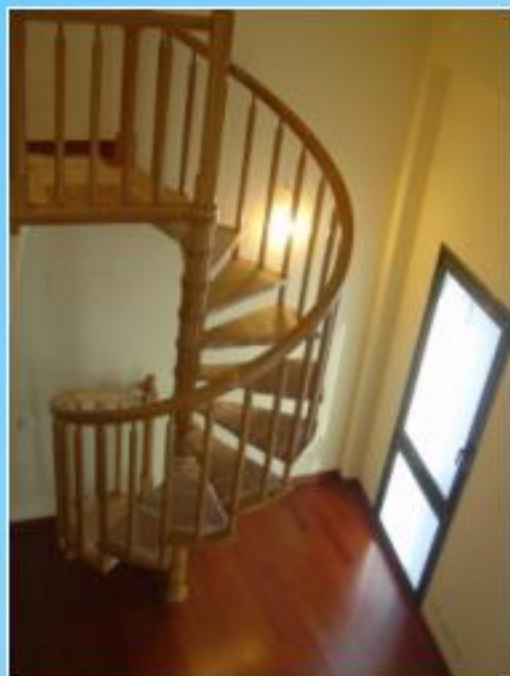
Escalera de caracol en madera, para subida a habitación. Vivienda tipo dúplex.