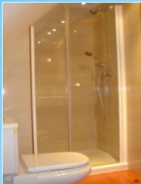
Plato de ducha en baño, equipado con mampara corredera y griferías mono-mando de primera calidad.