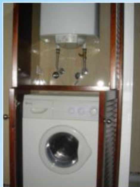
Lavadora - secadora (Balay) y termo eléctrico (Fagor), ubicados en cuarto de baño, ocultos en interior de mueble.